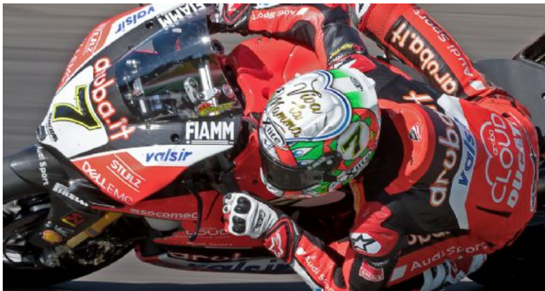
Chaz Davies in pista ad Imola sulla Ducati nella gara-2 del Mondiale Superbike

IMOLA – Dopo il terzo posto in gara-1 con Melandri, il team Ducati è tornato sul podio in gara-2 ad Imola con Chaz Davies. Il gallese, partito dalla pole position dopo il quarto posto di ieri, ha comandato la gara per un totale di 10 giri in fuga con Rea, per poi chiudere al secondo posto davanti ai tanti tifosi ducatiisti accorsi in circuito. «Abbiamo fatto del nostro meglio oggi, ma sfortunatamente non è bastato per vincere – si rammarica Davies – Le temperature sono salite e non avevo molto feeling, ero in difficoltà sia in fase di entrata in curva che in accelerazione. Quando Rea mi ha passato, ho pensato di provare a stare con lui, ma realisticamente sapevo che sarebbe stato troppo rischioso. Venti punti erano il massimo che potevamo ottenere oggi. Per me è molto importante comunque essere salito sul podio ad Imola. Ducati è qui vicino e ci sono tantissimi tifosi a supportarci. Avremmo voluto regalarci un risultato ancora migliore, ma ci siamo divertiti».