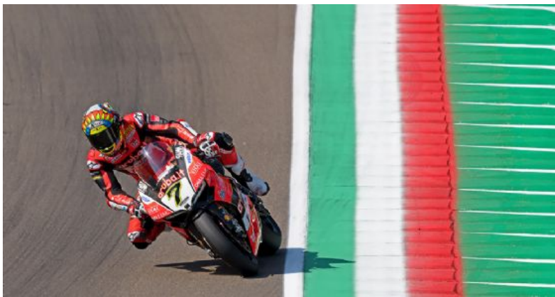
Chaz Davies in pista ad Imola sulla Ducati nelle prove libere del Mondiale Superbike

IMOLA – Il team Ducati è stato protagonista nel venerdì di prove libere ad Imola, teatro del quinto round del campionato mondiale Superbike e gara di casa, con Chaz Davies e Marco Melandri autori del primo e terzo miglior tempo rispettivamente. Entrambi i piloti hanno chiuso ogni sessione nelle prime tre posizioni, con il gallese capace di piazzare l'acuto sul finale della terza sessione di prove libere fermando il cronometro sul tempo di 1:46.686: «Sono molto contento di aver concluso la giornata in crescendo – ha spiegato Davies – Oggi abbiamo trovato gradualmente il nostro ritmo, senza metterci fretta né facendo tante modifiche all'assetto. Il piano sembra aver funzionato bene, e ci restano margini di miglioramento e modifiche da fare in vista della gara, quindi generalmente sono soddisfatto anche se stiamo ancora cercando di limare gli ultimi decimi. A questo livello, si tratta di dettagli. Al momento sembra che io e Rea abbiamo un piccolo vantaggio, ma è impossibile fare pronostici per la gara».