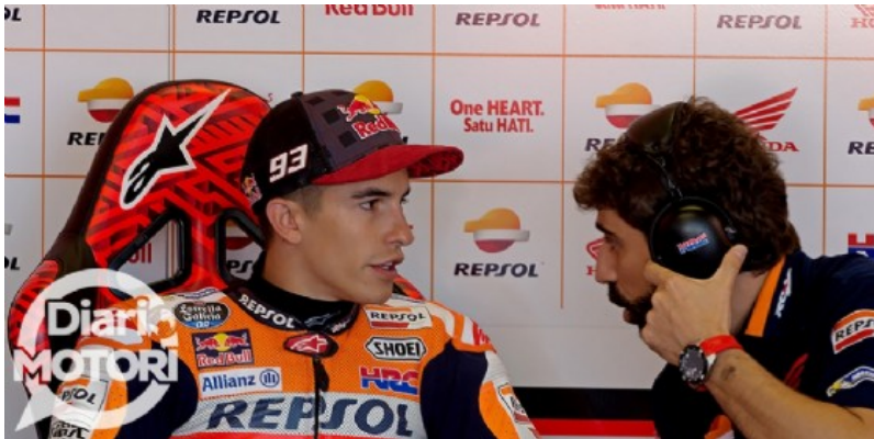
Marc Marquez ai box della Honda a Misano

MISANO ADRIATICO – Inizia forte il sabato mattina Marc Marquez. Dopo la caduta di cui è stato protagonista ieri pomeriggio, il campione spagnolo sembra finalmente riuscito ad esprimere tutto il potenziale della sua moto sulla pista di Misano, e si è portato in testa alla classifica nella terza sessione di prove libere del Gran Premio di San Marino: 1:32.958 il suo miglior tempo, che ha staccato di 154 millesimi il suo connazionale della Yamaha, e diretto rivale nella corsa al Mondiale, Maverick Vinales. Al terzo posto un'altra Honda, quella satellite di Cal Crutchlow. La migliore delle Ducati, quella del capolista iridato Andrea Dovizioso, è solo quarta, a quasi quattro decimi dalla vetta e seguita a breve distanza dal suo compagno di squadra Jorge Lorenzo, quinto.