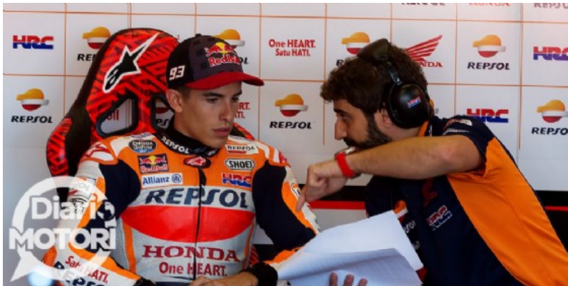
Marc Marquez nel box della Honda a Misano

MISANO ADRIATICO – È già Honda contro Ducati: nella prima sessione di prove libere del Gran Premio di San Marino, la casa di Tokyo e quella di Borgo Panigale si spartiscono equamente le prime sette posizioni. In testa ci sono i giapponesi, favoriti d'obbligo grazie alla loro vittoria dell'anno passato, con Marc Marquez che firma il miglior tempo in 1:33.556. Ma alle sue spalle gli mette il fiato sul collo il marchio locale, con il collaudatore e wild card Michele Pirro che si infila in seconda posizione a quattro decimi di divario, davanti al titolare e leader del Mondiale Andrea Dovizioso, a sei decimi dalla vetta.