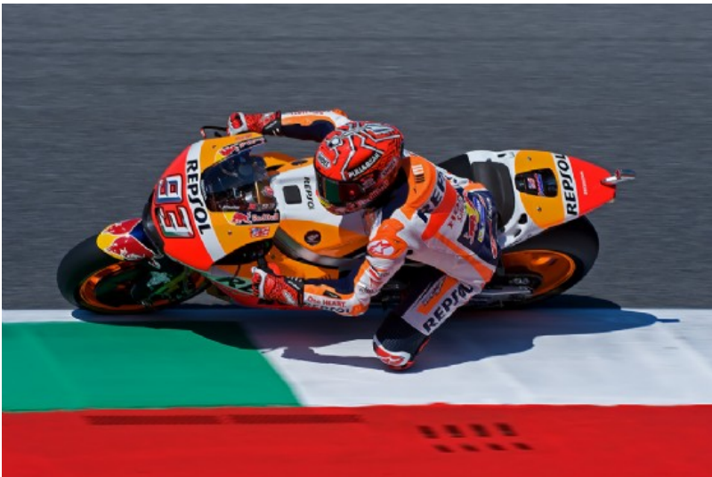
Marc Marquez in pista al sabato del Gran Premio d'Italia

fare». Per lui e anche per il suo compagno di squadra Dani Pedrosa, che scatterà subito davanti a lui, quinto: «Fin da ieri non ho sensazione di aderenza al posteriore – spiega il silenzioso iberico – Ho cercato di gestirla al meglio e alla fine sono contento della mia posizione: il tempo non è così veloce, ma forse per colpa del caldo».