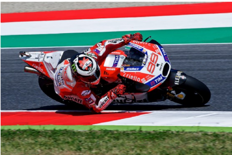
Jorge Lorenzo in sella alla Ducati sulla pista toscana