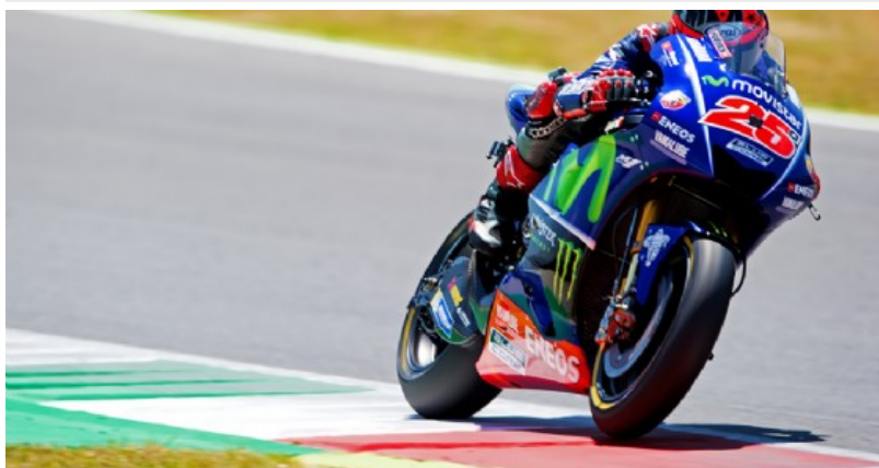
Maverick Vinales in azione sulla Yamaha nelle qualifiche al Mugello

Consiglia Condividi 34 persone consigliano questo elemento. Consiglialo prima di tutti i tuoi amici.