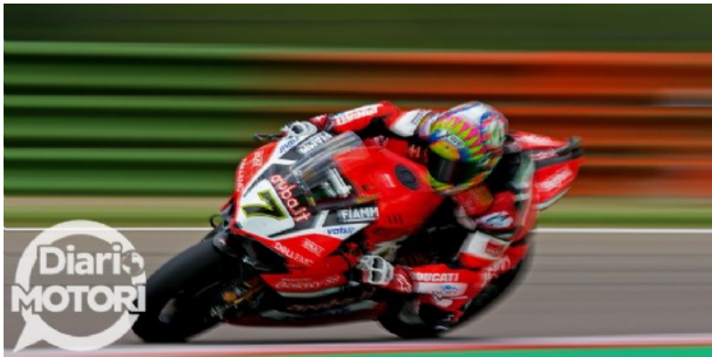
Chaz Davies in azione sulla sua Panigale R nelle prove libere a Imola

Consiglia Condividi 94 persone consigliano questo elemento. Consiglialo prima di tutti i tuoi amici.