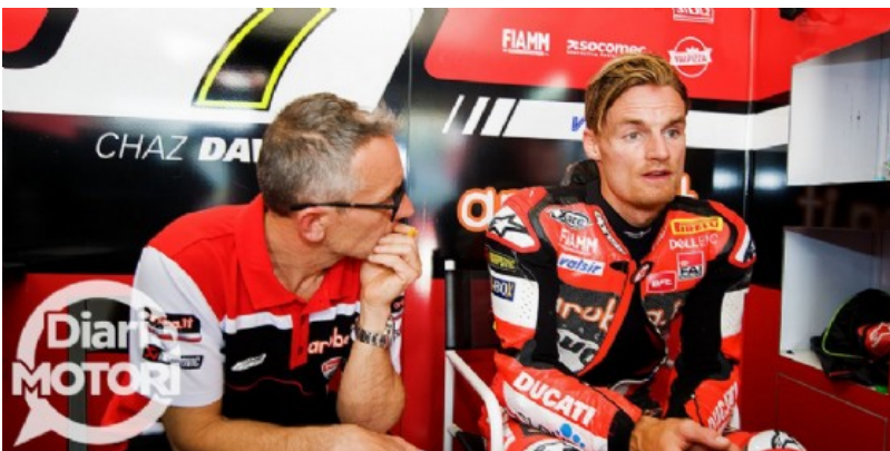
Davies all'interno del suo box

Anche Melandri è riuscito a migliorarsi nel pomeriggio nonostante alcune difficoltà in staccata, chiudendo a quasi un secondo dal compagno di squadra e alle spalle anche delle due Kawasaki di Jonathan Rea e Tom Sykes. Entrambi i piloti hanno così guadagnato l'accesso diretto alla Superpole 2. «È stata una giornata positiva per noi – commenta comunque Macio – Ho trovato subito buone sensazioni in sella su un tracciato che resta sempre difficile da affrontare, e la squadra ha fatto un ottimo lavoro. Chaz ha fatto un gran tempo e non sono sorpreso. Noi dobbiamo continuare a lavorare perché ci manca ancora qualcosa in frenata e ingresso curva, ma abbiamo fatto un bel passo avanti rispetto ad Assen e sono fiducioso per domani. Puntiamo quantomeno al podio. L'atmosfera ad Imola è fantastica. Il supporto dei tifosi ci dà una carica in più, e speriamo di farli divertire». Il team Ducati tornerà in pista sabato a partire dalle 8:45 per la terza ed ultima sessione di prove libere in vista di Superpole e gara-1 (partenza fissata per le ore 13).