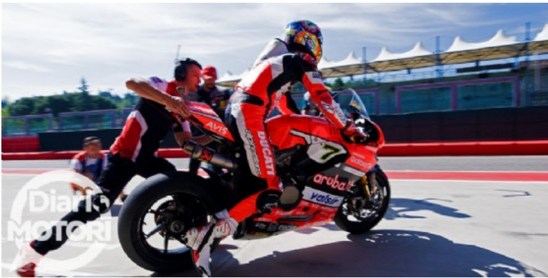
Marco Melandri esce dal garage Ducati sul circuito di casa