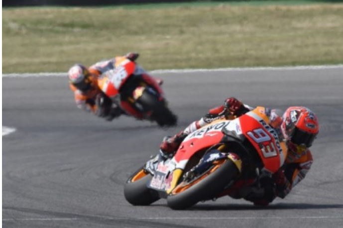
Marc Marquez in azione a Misano

sempre una bella sensazione – se la ride il padrone di casa – perché è forte, veloce e batterlo significa aver fatto una bella gara. Il divario è ancora molto ampio: 43 punti a cinque gare dalla fine. Ma sono felice della mia seconda parte della stagione finora: purtroppo non ho ancora vinto, ma devo continuare così fino alla fine». Solo a quel punto, alla fine, si potranno fare questi famigerati conti.