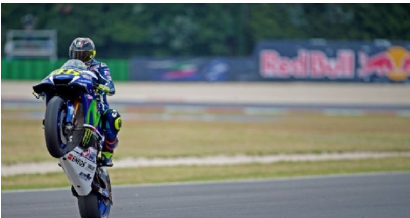
Valentino Rossi impenna al termine del GP di San Marino