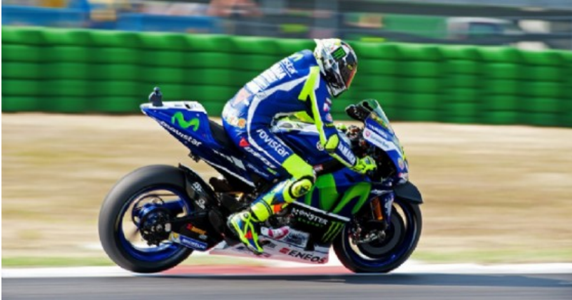
Valentino Rossi in azione a Misano

Stampa MISANO ADRIATICO – Valentino Rossi torna davanti a tutti a Misano. Nella quarta e ultima sessione di prove libere del Gran Premio di San Marino, con la sua Yamaha già in configurazione da gara, il Dottore stacca un tempo di 1:33.043 e fa il vuoto alle sue spalle: le due Honda di Dani Pedrosa e Marc Marquez sono rispettivamente seconda e terza con un tempo quasi in fotocopia (separati da un solo millesimo), ma staccati di oltre quattro decimi dall'idolo locale. Ancora peggio Jorge Lorenzo, quarto a quasi mezzo secondo. Completano le prime dieci posizioni Cal Crutchlow, Pol e Aleix Espargaro, Maverick Viñales e le due Ducati di Andrea Dovizioso e Michele Pirro. Ora il via alle qualifiche.