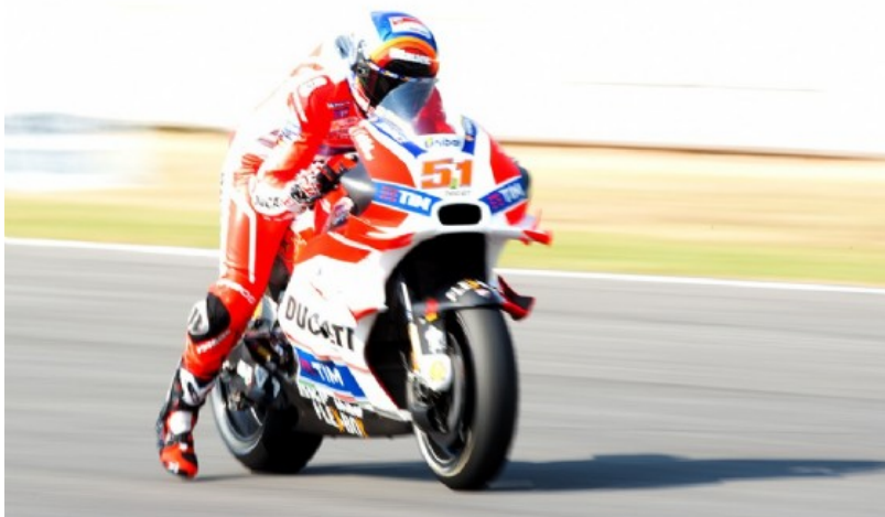
Michele Pirro in azione a Misano