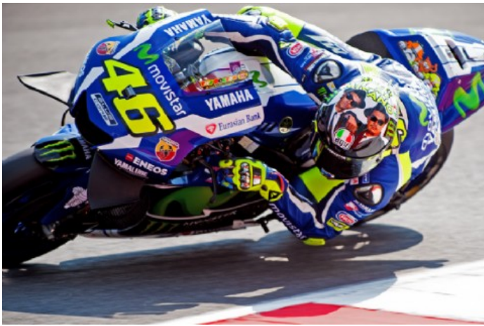
Valentino Rossi in azione sulla sua pista di casa