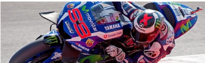
Jorge Lorenzo in qualifica a Misano