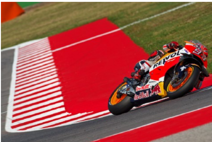
Marc Marquez in pista nel GP di San Marino

Alla vista dei risultati delle qualifiche, ha tirato un sospiro di sollievo anche Valentino Rossi. Che, sempre per colpa delle famigerate Michelin asimmetriche, che tormentano lui e molti suoi colleghi ormai dall'inizio del weekend, ha rischiato seriamente di restare fuori dalle prime file. Un rischio che nella sua Misano non si poteva proprio permettere: «Dopo la prima gomma ero un po' preoccupato: ero piuttosto lento, slittavo molto – racconta il Dottore – Per tutto il weekend le gomme posteriori mi hanno dato prestazioni diverse. Perciò speravo che la seconda andasse meglio, e infatti è stato così. Sono andato più forte, ho ottenuto un buon tempo, 1:32.1, e una buona seconda posizione in griglia di partenza. Partire dalla prima fila è molto importante ovunque, ma in particolare a Misano, dove non è facile superare perché il tracciato è stretto» . Scattando dal centro della prima fila, e con quel passo gara superiore a tutti mostrato nell'ultimo turno di prove libere, le prospettive per domani sembrano decisamente più rosee. Gomme permettendo, s'intende: «Ora ci dobbiamo concentrare sugli pneumatici, perché abbiamo diverse idee da seguire sulle mescole davanti e dietro, e vedremo nel warm up quale scegliere per la gara. Jorge è andato forte, ha un buon passo ed è un candidato alla vittoria. In gara potrebbe piovare? Ma no, basta... speriamo sia asciutto» .