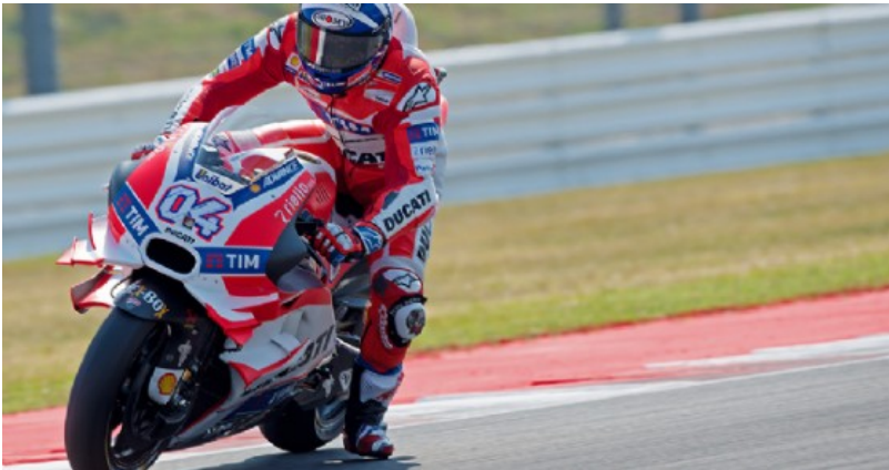
Andrea Dovizioso in gara a Misano

Stampa MISANO ADRIATICO – I due ducati Andrea Dovizioso e Michele Pirro hanno ottenuto rispettivamente il sesto ed il settimo posto nel Gran Premio di San Marino, disputato oggi a Misano. Andrea Dovizioso, che scattava dalla seconda fila grazie al sesto tempo ottenuto ieri in qualifica, ha lottato nei primi giri con Marquez, Pedrosa e Viñales per il quarto posto. Il pilota romagnolo è poi transitato in sesta posizione all'undicesimo giro ed ha concluso così la sua gara. «Peccato perché oggi mi aspettavo un risultato diverso in gara – si rammarica Desmodovi – Purtroppo facciamo ancora fatica a far girare la moto come quella dei nostri avversari e con il passare dei giri questa differenza aumenta. Per poter colmare il gap devo usare tanta energia fisica, fare molta forza sul manubrio e la mia guida diventa sporca e perdo fluidità. Per fare una gara costante dovrei spingere meno nei primi giri, ma per rimanere con il gruppo di testa siamo costretti a farlo».