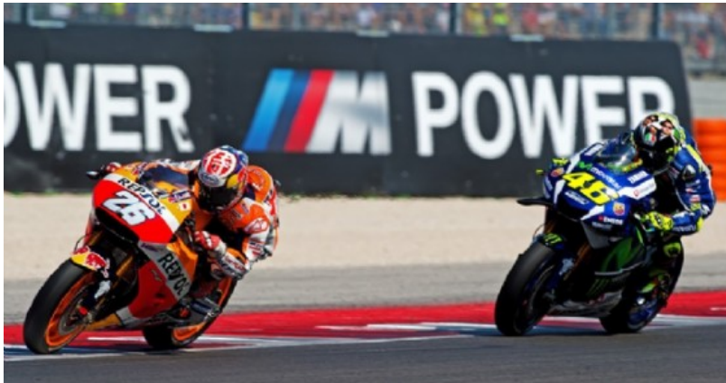
Dani Pedrosa davanti a Valentino Rossi in gara