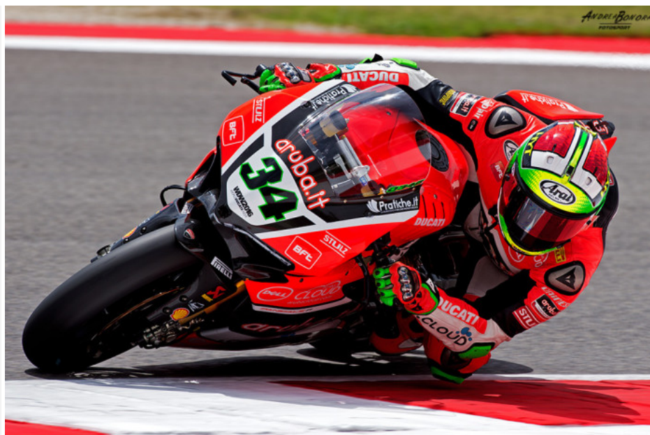
Davide Giugliano – Ducati Panigale 1199R | Misano SBK Gara-2