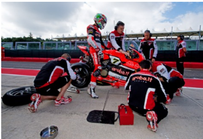
La Ducati di Davies ai box