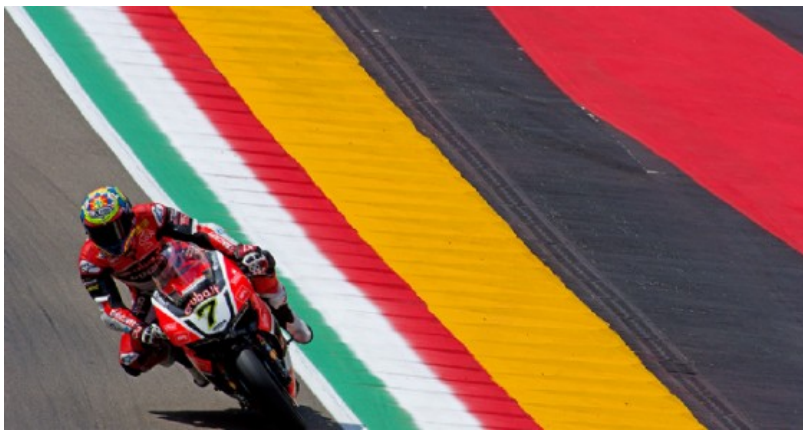
Chaz Davies in azione sulla sua Ducati a Imola