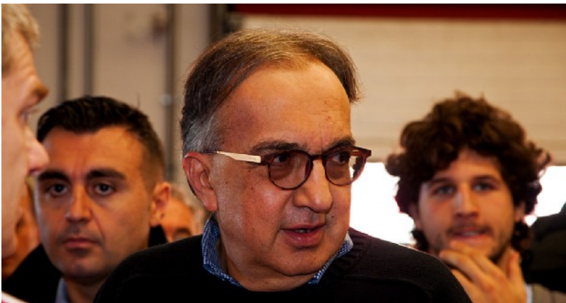
Sergio Marchionne alle finali mondiali Ferrari al Mugello

Tutto su: Formula 1 Regolamento Formula 1 Mondiale F1 Red Bull Ferrari Red Bull racing Renault F1 Scuderia Ferrari FIA FOM Italia Bernie Ecclestone Marchionne Sergio Todt Jean