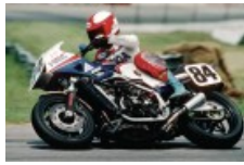
Fred "Flying" Merkel, SBK legend!