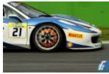
Ferrari Challenge a Monza, Trofeo Pirelli 4 - 5 - 6 Aprile (FOTO)