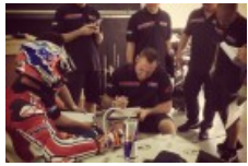
Stoner ancora a Sepang per un test con HRC