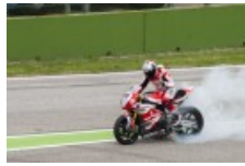
SuperBike: Bimota conquista la vittoria a Imola!