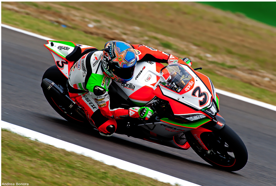
Max Biaggi sulla sua RSV4