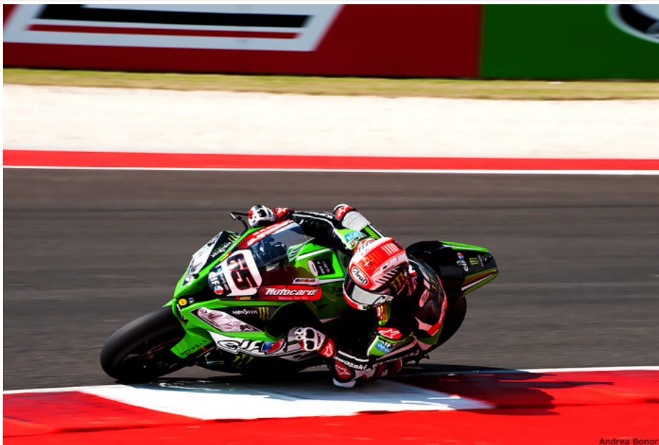
Jonathan Rea Kawasaki Ninja ZX-10R Misano Gara 2