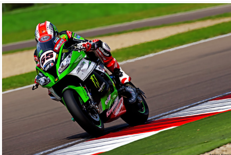
Jonathan Rea su Kawasaki Ninja ZX-10R