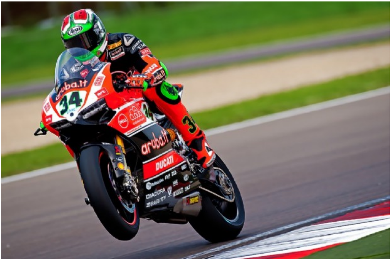
Davide Giugliano in pole a Imola

Tutto su: Motociclismo Superbike Ducati Kawasaki Kawasaki RT BMW Motorrad Motorsport Aprilia Racing Ducati team Italia Sykes Tom Davide Giugliano Chaz Davies Leon Haslam Jonathan Rea Ayrton Badovini