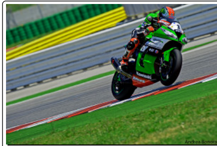
Tom Sykes #1 (GBR)

Il Campione del Mondo in carica e leader della stagione 2014 del Mondiale Superbike Tom Sykes ha rinnovato il suo contratto con il Kawasaki Racing Team per altri due anni. Approdato alla Casa di Iwata nel 2010, il 29enne pilota nativo della contea dello Yorkshire ha vinto il Titolo iridato con la ZX-10R nel 2013 ed è attualmente in testa alla serie con 44 punti di vantaggio sugli avversari.